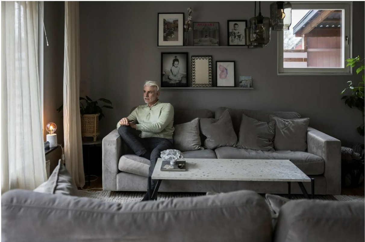
Lampan i vardagsrummet är alltid tänd, för Loves skull.

– Jag känner ingen skuld. Jag tänker att jag har varit en jättebra pappa. Jag kunde ha varit mer stöttande i skolan, men det har inte med självmordet att göra. Jag tror att jag snarare har varit en skyddsfaktor mer än en riskfaktor.